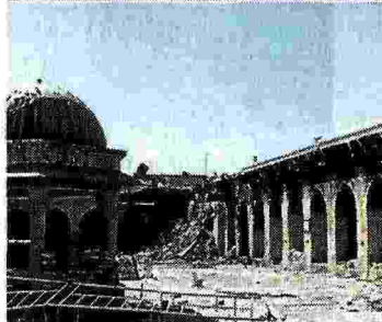
Aleppo, prima e dopo