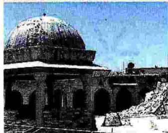
Aleppo Il minareto prima e dopo

ROMA — In oltre 40 mesi di conflitto si contano 191 mila morti e tre milioni di rifugiati. Metà della popolazione, sei milioni e mezzo di persone, ha lasciato le proprie case, l'emergenza umanitaria non si spegne, non c'è cibo, non ci sono medicine, nelle ultime 36 ore sono stati uccisi 43 bambini. La guerra in Siria è «una tragedia alla quale non si può continuare a guardare da lontano — dice Francesco Rutelli — l'Europa deve fare di più, ignorare gli avvenimenti attorno all'antico Eufrate è impossibile, il disastro si espande». Un disastro che comprende anche la distruzione delle Memorie dell'Antichità. Siti archeologici, castelli, palazzi, minareti, sono sottoposti a bombardamento e danneggiati, alcune volte irrimediabilmente. Tutto questo è testimoniato nella